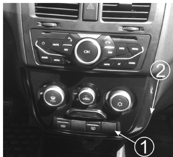
Рис.4 Вид на панель приборов.