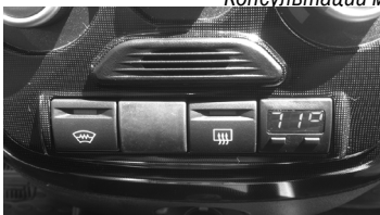
Рис.5 Вид установленного БК

4.5.2 Протяните жгут проводов БК до автомобильной диагностической колодки (находится внутри вещевого ящика слева (поз.2, рис.6 )). Отщелкните крепление автомобильной диагностической