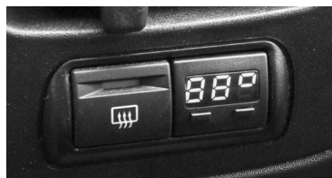
Рис.3 Вид установленного БК