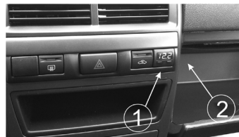
Рис.6 Вид установленного БК

4.5.3 Подключите 6-контактную колодку жгута БК к бортовому компьютеру и установите его (поз.1, рис.6).